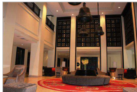
▼ブータンの伝統様式にこだわったホテル