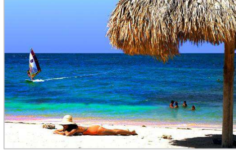
▼人気のリゾート地バラデロ