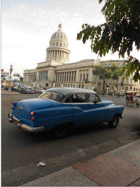
▼旧市街オールド ハバナ