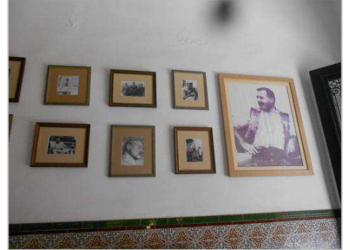
▼ヘミングウェイが定宿としたホテル