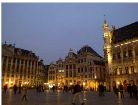
▼美しい世界遺産グランプラス

このたびブリュッセル国際空港および地下鉄駅で発生した連続テロ事件によりお亡くなりになった方々のご冥福を心よりお祈りするとともに、ご遺族・ご友人の皆さま、負傷なされた皆さまにお見舞い申し上げます。