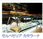
セルベセリアカタラナ