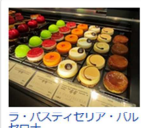
フ・パステリア・パルセロナ