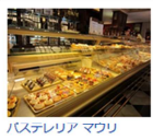
パステリアマウリ