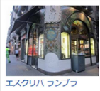
エスクリバランソ