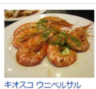
キオスコウニベルサル

トラベルコちゃん『海外 現地クチコミ』は、今後も掲載都市・スポットを順次拡大していく予定です。現地のプロだからこそ知る情報をチェックして、これまでよりさらに充実した海外旅行をお楽しみください。