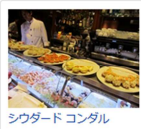
シウダートコンダル