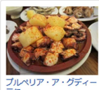
フルベリア・ア・グディーニャ